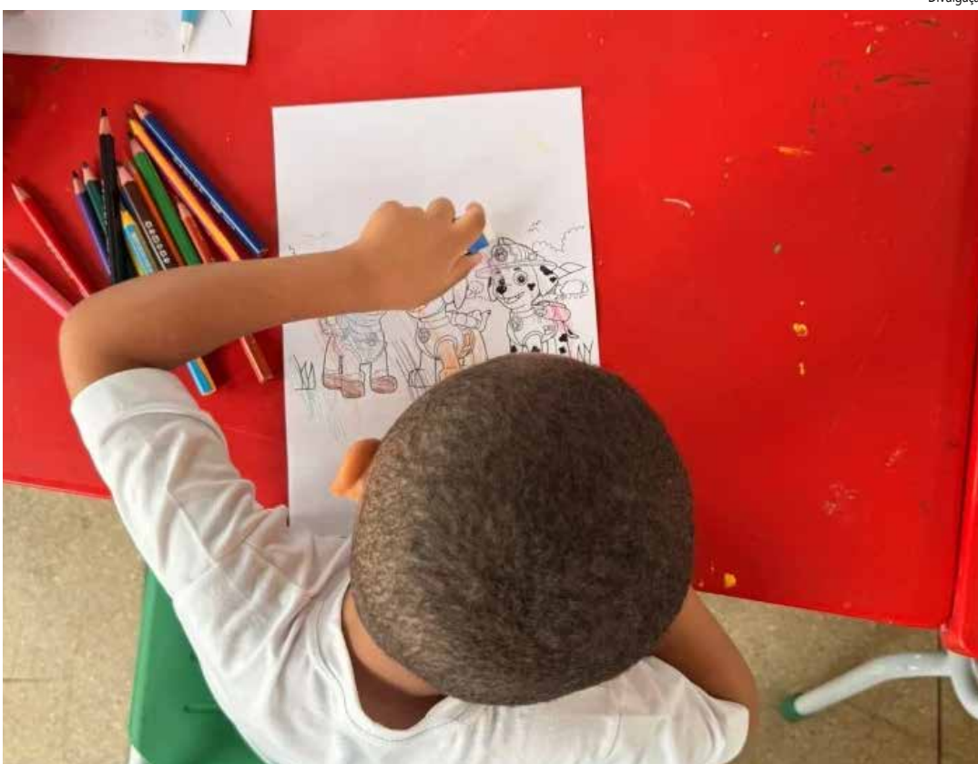
Ação da Semus atende mais de 120 crianças e adolescentes e reforça rede de saúde mental.

Atendimento contínuo e suporte às famílias